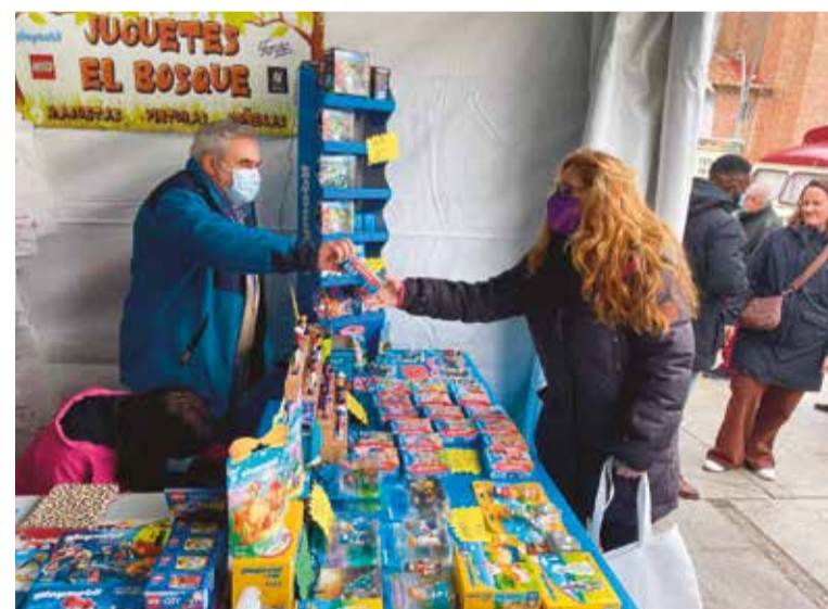
El comercio local será fortalecido con los presupuestos de este año

Además, se va a crear una Asesoría Laboral y de Acompañamiento en la Tramitación,