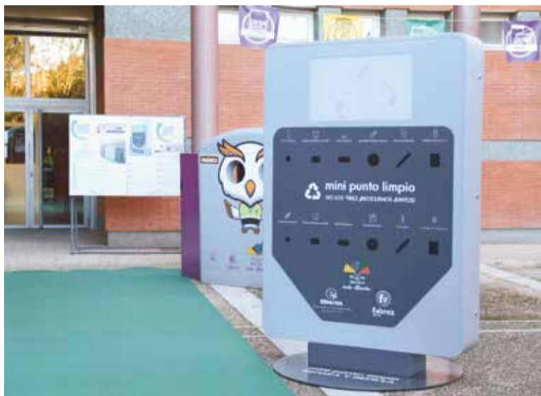
La percepción ciudadana de la limpieza urbana, uno de los temas tratados