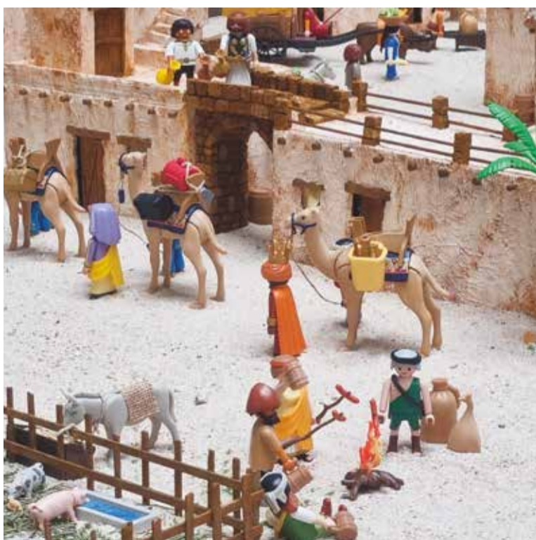
Más de 200 piezas forman el particular belén de Playmobil

Sin duda, la ciudadanía es la verdadera protagonista de esta programación que ha incluido