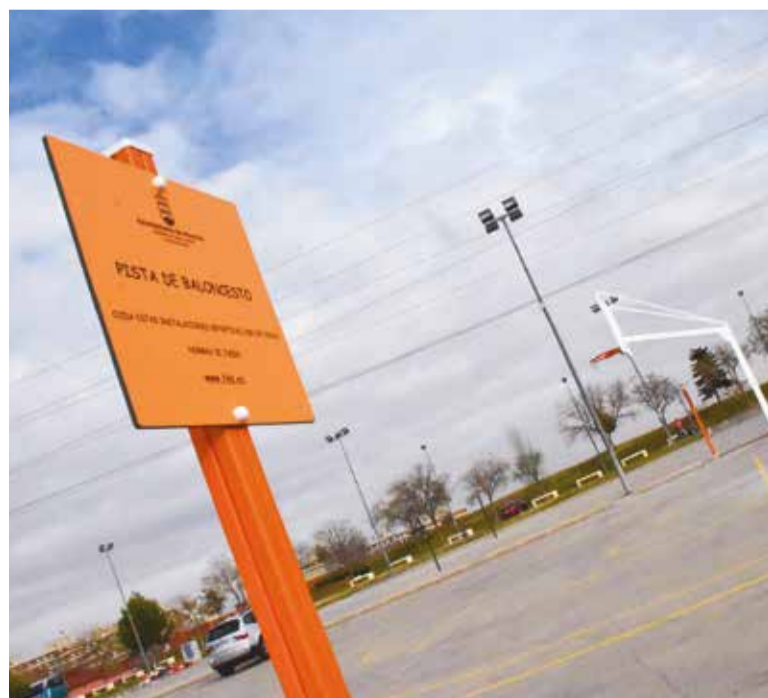
La reposición cuenta con un importe total de 40.108,55 euros de inversión