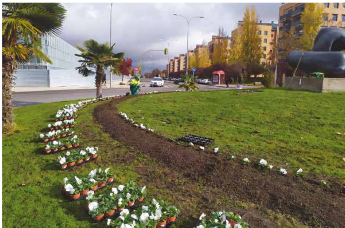
El objetivo es contar con flores estacionales todos los meses

sión a fin de que la ciudadanía pueda contar con flores estacionales todos los meses del año.