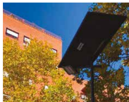
Una de las farolas del municipio con placas solares led

● El Ayuntamiento de Alcorcón ha puesto en marcha, a través de la empresa pública ESMASA, un proyecto piloto para la instalación de farolas, autónomas y sostenibles. Con esta iniciativa, se pone una vez más la innovación al servicio de la ciudad, en este caso para mejorar la iluminación, buscando conciliar la seguridad de los vecinos y vecinas con la sostenibilidad.