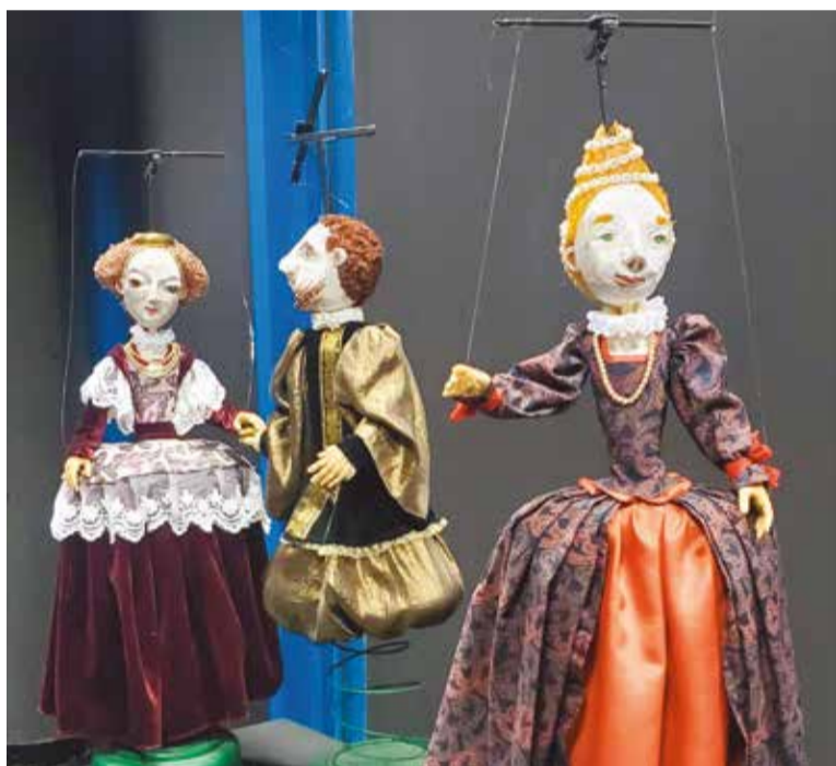
El Centro del Títere cuenta con una interesante exposición interactiva

Miguel Ángel Blanco, donde se realizan actividades de divulgación y cuenta con salas de exposiciones y exhibición de espectáculos, un laboratorio de investigación y creación, un centro de documentación y archivo y una escuela de formación profesional y abierta, entre otros espacios.