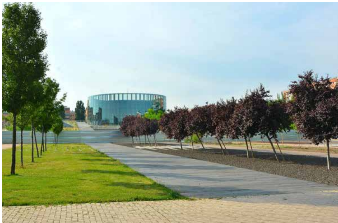
Si esta iniciativa progresa, el CREEA podría contar con una solución este mismo año

"Por ello, el inicio de este expediente es una buena noticia para la ciudad y para el patrimonio de los vecinos y vecinas", aclaró la alcaldesa.