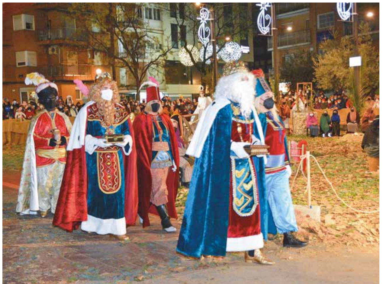
Pág. 8 y 9 Los Reyes Magos visitaron el Belén Viviente que se representó en la Plaza de España

● La programación navideña de Alcorcón ha llenado de ilusión las calles de la ciudad con diversas actividades para todos los gustos y edades para acabar con un colofón de lujo: la llegada de Sus Majestades Los Reyes Magos de Oriente a Alcorcón.