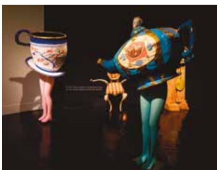
La Fundación desarrolla su proyecto en el Centro Cívico Miguel Ángel Blanco

● Alcorcón cuenta con un lugar de referencia para los amantes del arte de la marioneta: el Centro del Títere, un espacio integral dedicado a la divulgación, formación, creación, estudio y difusión de este arte y que cuenta con salas de exposiciones y exhibiciones, un laboratorio de investigación y una escuela de formación profesional y abierta, entre otros espacios.