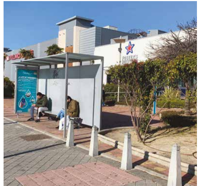
La mejora del transporte es esencial en esta zona

El consenso entre las partes implicadas, unido a las quejas de la ciudadanía, implica el cambio de ubicación e infraestructuras a través del Consorcio Regional de Transportes de la Comunidad de Madrid. El objetivo no es otro que proveer de seguridad, comodidad e información a los usuarios, colocando la parada unos metros antes, junto al cruce regulado por semáforos a la altura de varios comercios, para resolver definitivamente la problemática y prestar el mismo servicio que el resto de paradas de autobús.