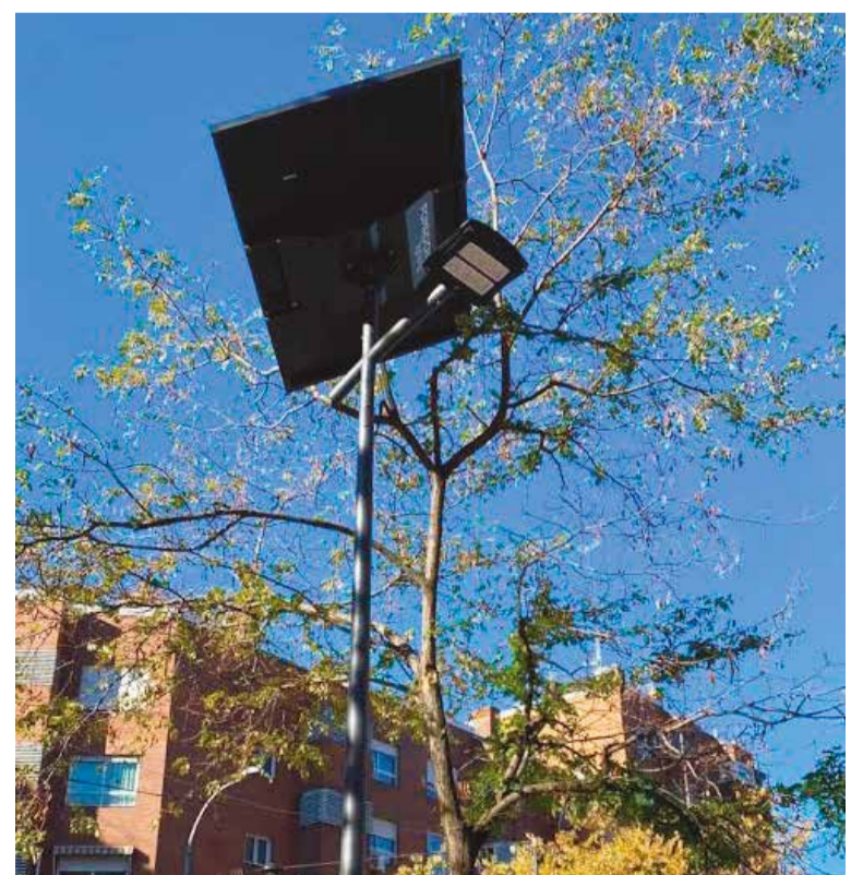
Una de las farolas del proyecto piloto del municipio

Esta iluminación se basa en energía renovable, con un impacto ambiental mínimo. Las baterías están programadas para calcular la carga disponible y ajustar el flujo luminoso en función de este, que tiene incorporado un sistema de apagones.