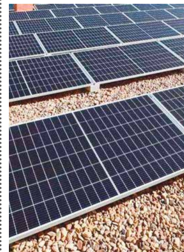
Paneles de energía fotovoltaica en edificios municipales

El proyecto de energía sostenible presentado por la Concejalía de nuestra ciudad incorpora la instalación de energía fotovoltaica en edificios municipales, la incentivación de energía solar en todo el municipio, la instalación de cargadores para vehículos eléctricos con fuentes renovables, la sustitución de luminarias de edificios municipales a tecnología led y todo ello bajo el paraguas de la creación de una comunidad energética local de la que ya presentamos en su día la correspondiente declaración de interés al Ministerio para la Transición Ecológica y el Reto Demográfico (MITECO).