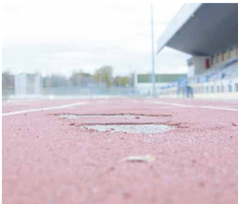
La pista de atletismo presenta un gran deterioro