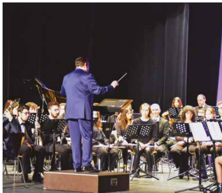
Esta escuela cumple 40 años de formación

Pero además de la cohesión de los músicos desde que dan sus primeros pasos en el mundo de la música, el director de la escuela tiene claro que uno de los puntos fuertes de la institución es la dualidad entre la Escuela y el Conservatorio: "Somos uno de los pocos centros de España y de Europa, que tienen una escuela de música no reglada y un conservatorio profesional".