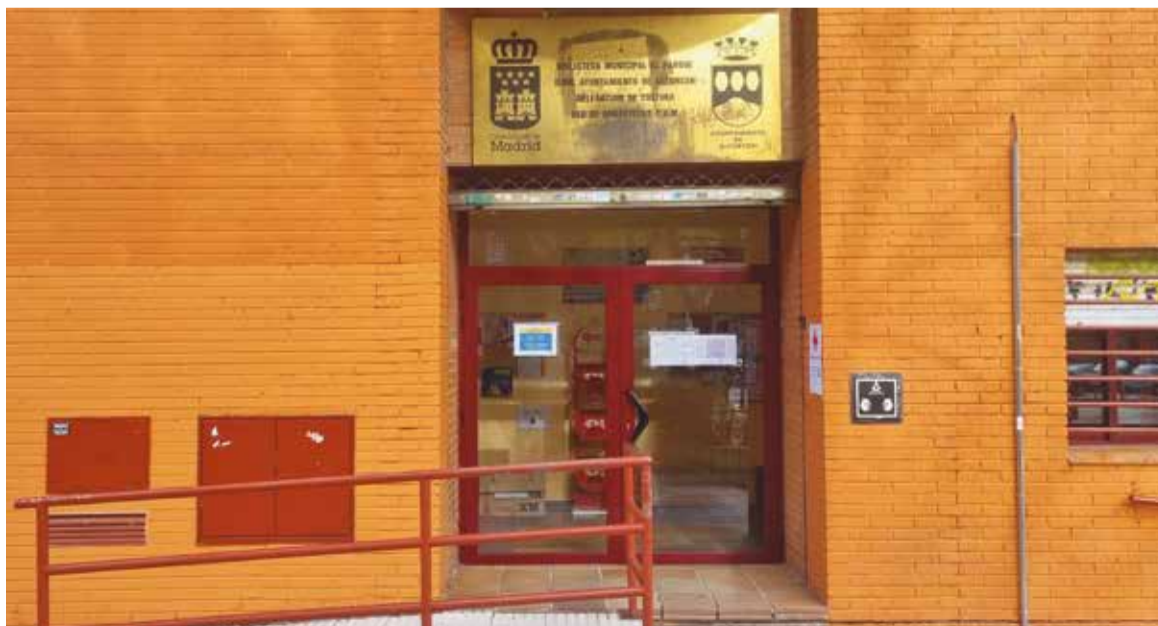
La biblioteca municipal 'El Parque', lugar escogido para homenajear a la escritora

La biblioteca municipal 'El Parque' será el lugar que la localidad ha elegido para ofrendar a Grandes por su extraordinaria calidad y su compromiso con la literatura