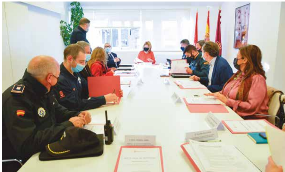
La Junta Local de Seguridad abordó diferentes cuestiones en materia de seguridad del municipio

En esta sesión se evaluaron los datos de la situación de la seguridad por parte de la Poli-