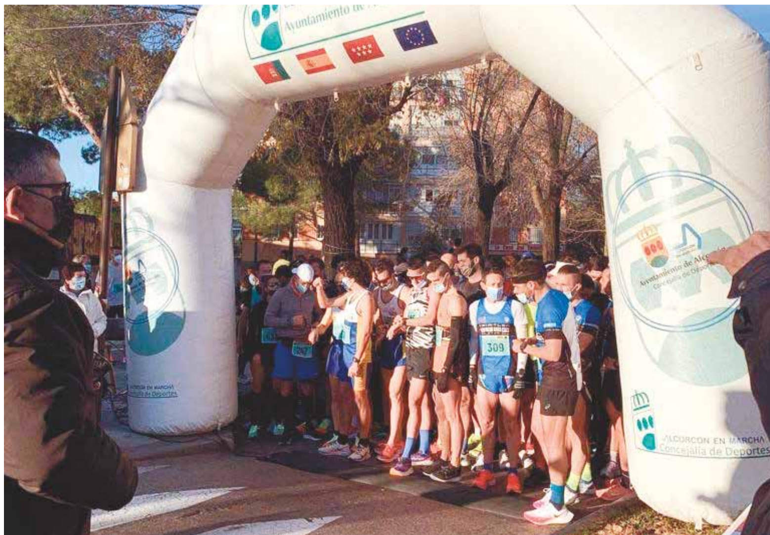
La San Silvestre de Alcorcón contó con éxito de participación y de público, que animó a los corredores a su paso por la ciudad

El recorrido se iniciará en la Avenida de la libertad para finalizar en la Plaza de España, donde los Reyes Magos saludarán a los vecinos y vecinas desde el balcón del Ayuntamiento de Alcorcón.