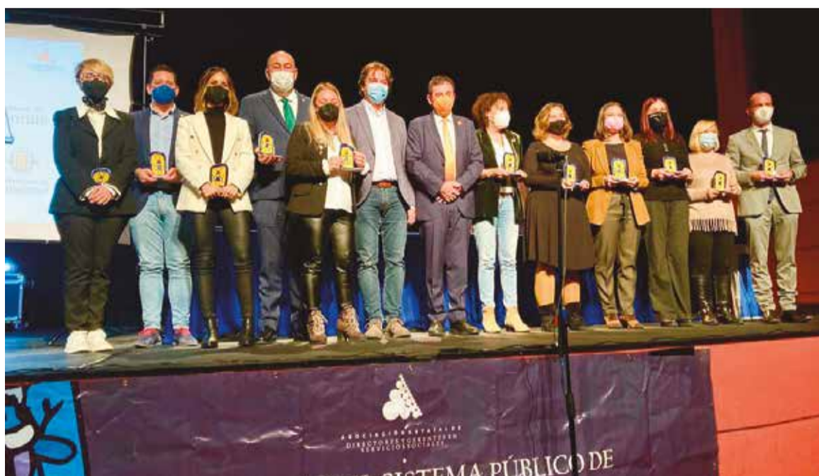
Premiados del XXVIII Congreso de la Asociación de Directores y Gerentes de Servicios Sociales

nes no periódicas, de naturaleza económica, destinadas a aquellas personas integradas en una unidad de convivencia cuyos recursos resulten insuficientes para hacer frente a gastos específicos, de carácter ordinario o extraordinario.