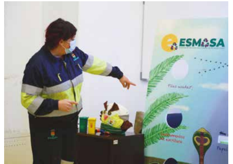
Una de las trabajadoras de ESMASA explica cómo reciclar nuestros residuos

Las mañanas estuvieron reservadas para los niños y niñas de quinto y sexto de primaria de los colegios públicos de Alcorcón, que además de ver las exposiciones y herramientas de ESMASA, pudieron asistir a un taller de manualidades con