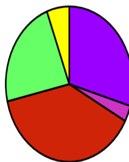
IMPORTES EN FUNCIÓN DEL TIPO DE CONTRATO - Anualidad 2021

■ CONTRATOS DE SUMINISTROS ■ CONTRATO DE OBRAS ■ CONTRATO DE SERVICIOS ■ CONTRATOS ARTISTICOS ■ OTROS