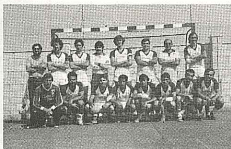
Equipo senior masculino 2.ª, de la Sección de Balonmano del Club Municipal Alcorcón.

En la actualidad hay matriculados aproximadamente 215 alumnos. Las Escuelas están ubicadas en los Polideportivos de Prado de Santo Domingo y en el de La Canaleja. Es posible que muy pronto también se impartan clases en el Colegio de la Inmaculada.