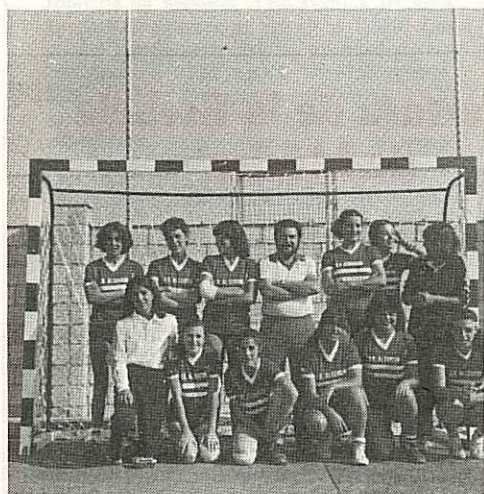
Equipo senior femenino absoluto (provincial), de la Sección de Balonmano del Club Municipal Alcorcón.