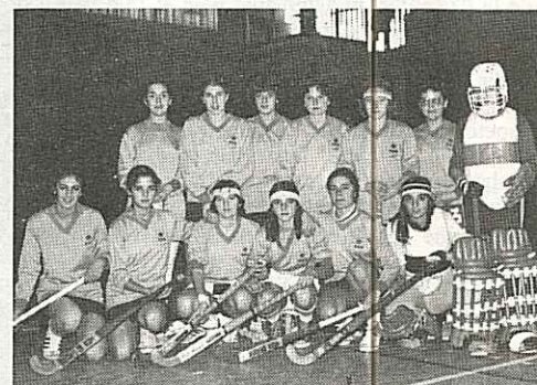
Equipo juvenil femenino de Alcorcón, Campeón de España de Hockey-Sala.

Tan rotundo triunfo fue logrado a pesar de las diversas adversidades: un largo viaje, falta de tiempo para descansar y jugar los tres primeros partidos a continuación. El encuentro con el equipo local —el Málaga— era sobre el papel el más difícil, de hecho fue el más brillante.