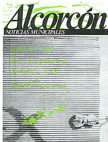
Portada sobre obra de A. Tapiés (porta metálica i viol)

En la información del número de mayo, referida a la futura extensión de la Universidad Politécnica, debería constar que se situará en la nueva carretera que unirá la N-V de Extremadura con la carretera de La Coruña.