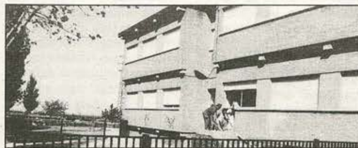
Obras en el CP Miguel Hernández.

ras de infraestructuras, se inscribe dentro del marco de los requisitos exigidos por la LOGSE para los colegios públicos. El convenio firmado por el Ministerio de Educación y Ciencia con los Ayuntamientos permite hacer frente a los problemas de los centros escolares.