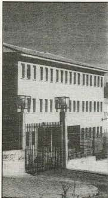
En contra de las frías estadísticas que señalan a la zona sur de Madrid con el mayor índice de fracaso escolar, el Instituto 7 de Alcorcón ha venido a demostrar que con una buena planificación del curso escolar junto a la buena predisposición de profesorado y alumnos se consiguen magníficos resultados.

Por otra parte, otra de las prácticas pedagógicas que se sigue en este Instituto es la disciplina que