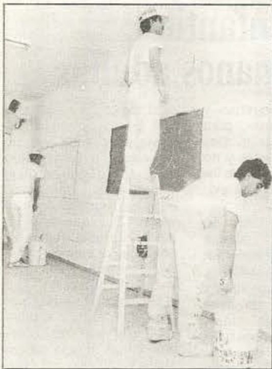
Obras en el CP Jesús Varela.

El Ayuntamiento está llevando a cabo un Plan de mejoras de infraestructuras en colegios públicos durante 1992.