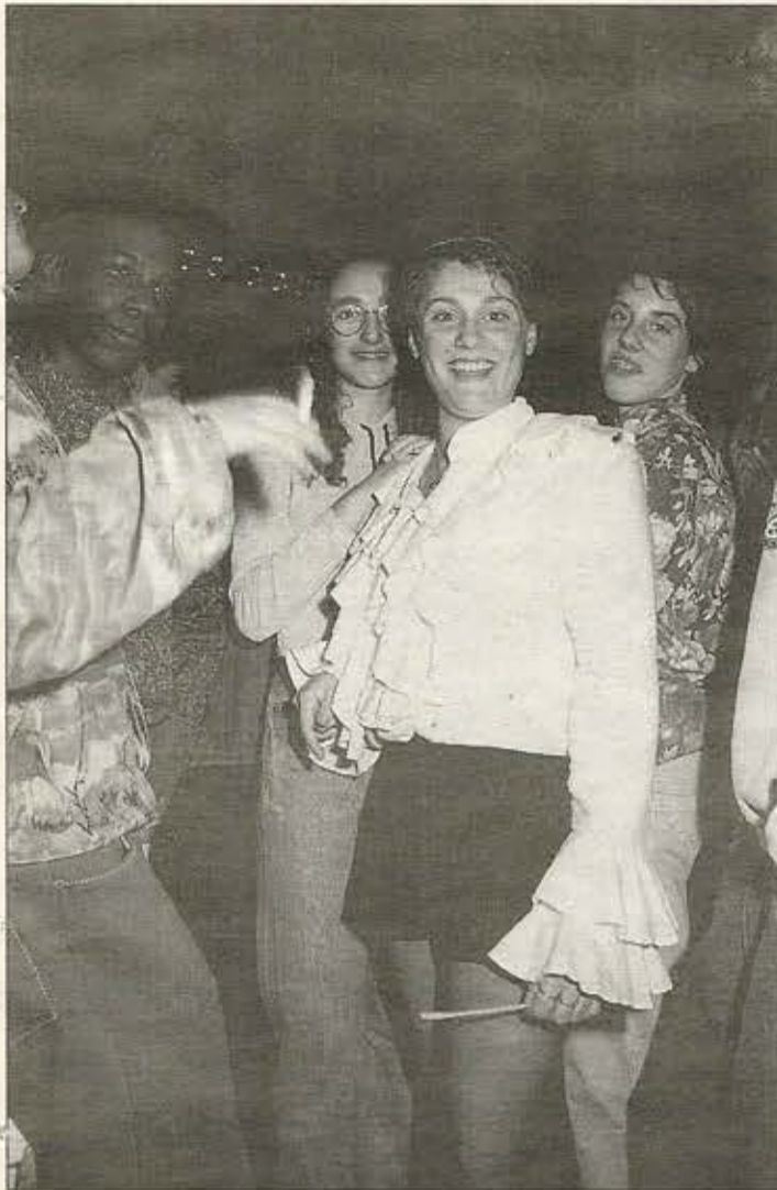
El comportamiento general de los jóvenes que acuden a «Costa Polvoranca» es ejemplar.