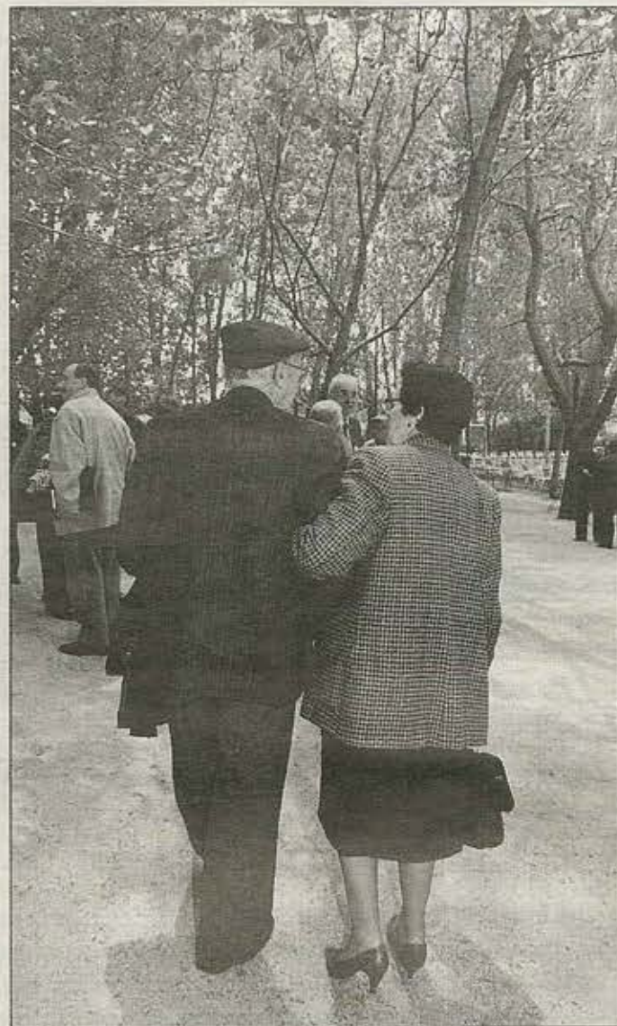
1994 ha sido el Año Internacional de la Familia, cuya base está en nuestros mayores.