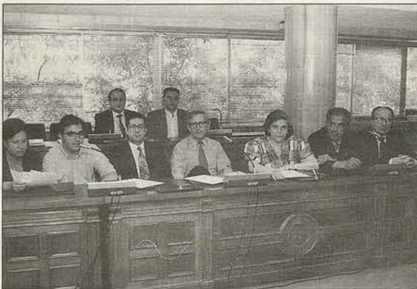
Grupo Municipal del PP.

De este modo, tan sólo seis días después de celebrar el aniversario de nuestra Constitución, podremos volver a festejar tal acontecimiento esta vez junto a nuestro Rey, que es la encarnación viva del proceso democratizador en España y primer garante de nuestro sistema constitucional