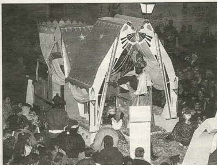
La Navidad de Alcorcón culmina con la cabalgata de Reyes, donde los niños y los no tan niños son los auténticos protagonistas.

Las fiestas navideñas se perfilan como las auténticas protagonistas del mes de diciembre. Para celebrarlo Alcorcón engalana sus calles, plazas y avenidas con arcos luminosos que estarán presentes del 17 de diciembre al 7 de enero.