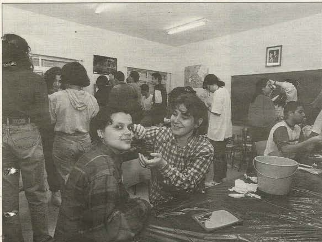
La Concejalía de Juventud ha organizado una serie de actos, desde el 17 de diciembre, para los jóvenes de la localidad, con motivo de la inauguración del Centro Joven.

Precio: 500 pesetas. Lugar: Centro Joven.