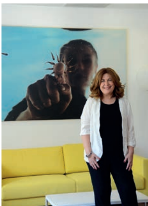
Natalia de Andrés Alcaldesa de Alcorcón