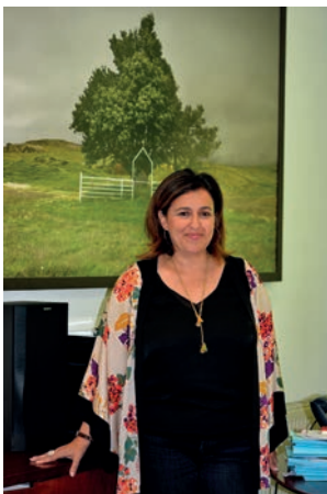
Sonia López Cedena

3ª Teniente de Alcaldesa Concejala de Cultura y Participación