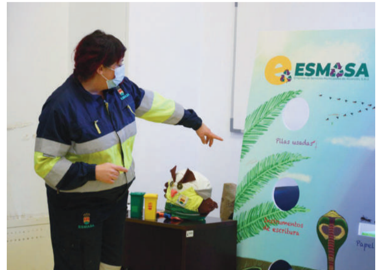
Una de las trabajadoras de ESMASA explica cómo reciclar nuestros residuos

Las mañanas estuvieron reservadas para los niños y niñas de quinto y sexto de primaria de los colegios públicos de Alcorcón, que además de ver las exposiciones y herramientas de ESMASA, pudieron asistir a un taller de manualidades con