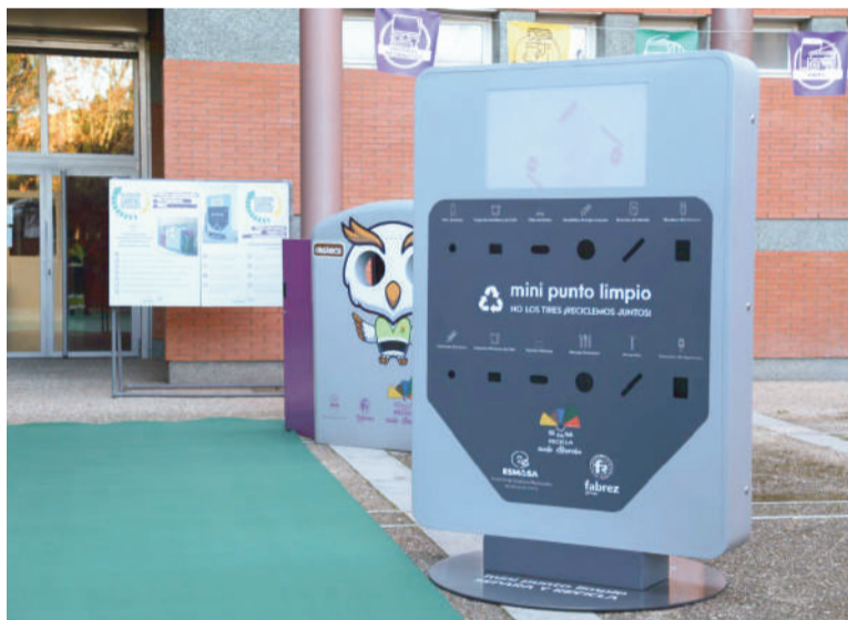
La percepción ciudadana de la limpieza urbana, uno de los temas tratados