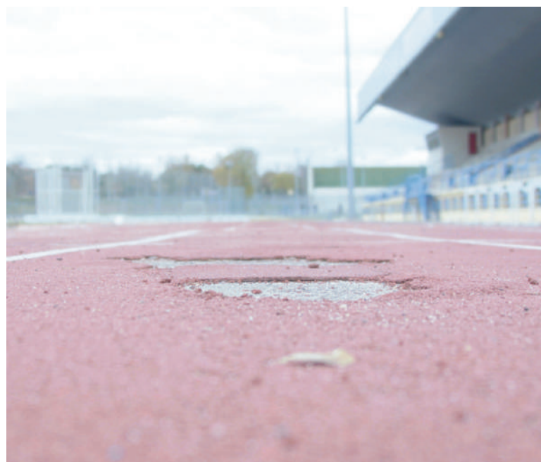
La pista de atletismo presenta un gran deterioro