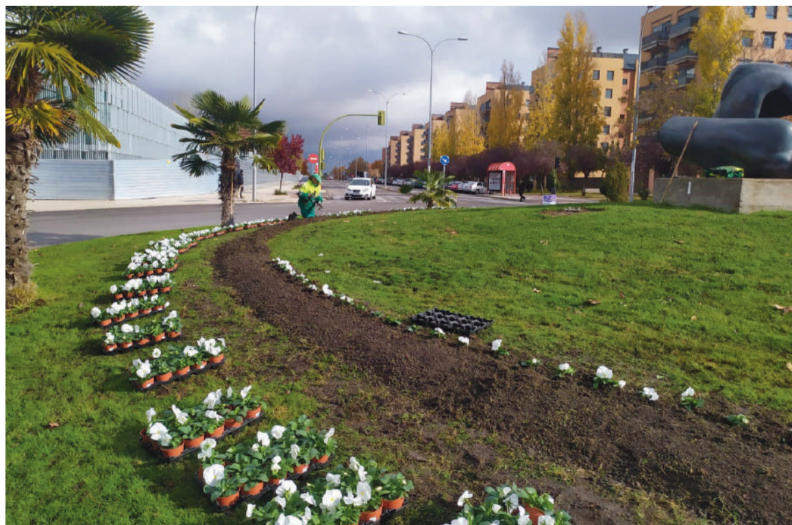
El objetivo es contar con flores estacionales todos los meses

sión a fin de que la ciudadanía pueda contar con flores estacionales todos los meses del año.