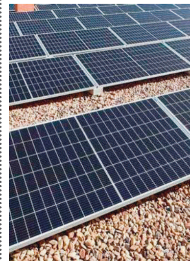
Paneles de energía fotovoltaica en edificios municipales

El proyecto de energía sostenible presentado por la Concejalía de nuestra ciudad incorpora la instalación de energía fotovoltaica en edificios municipales, la incentivación de energía solar en todo el municipio, la instalación de cargadores para vehículos eléctricos con fuentes renovables, la sustitución de luminarias de edificios municipales a tecnología led y todo ello bajo el paraguas de la creación de una comunidad energética local de la que ya presentamos en su día la correspondiente declaración de interés al Ministerio para la Transición Ecológica y el Reto Demográfico (MITECO).