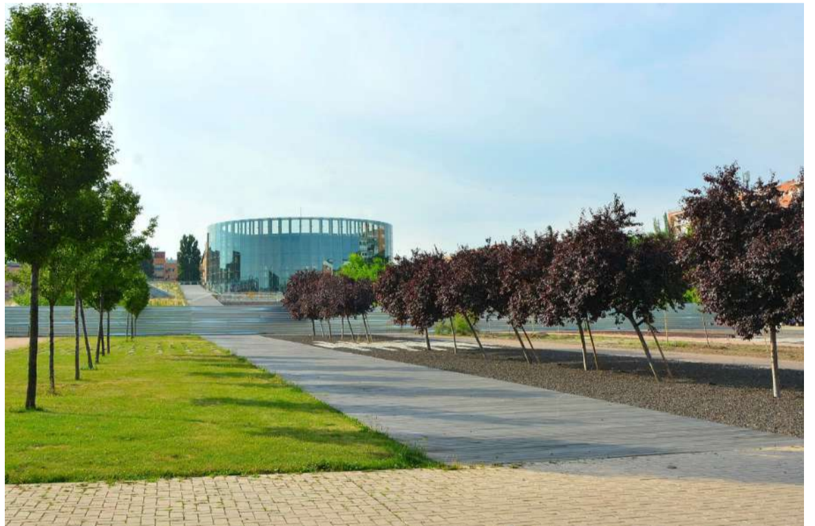
Si esta iniciativa progresa, el CREEA podría contar con una solución este mismo año

"Por ello, el inicio de este expediente es una buena noticia para la ciudad y para el patrimonio de los vecinos y vecinas", aclaró la alcaldesa.