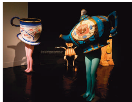
La Fundación desarrolla su proyecto en el Centro Cívico Miguel Ángel Blanco

● Alcorcón cuenta con un lugar de referencia para los amantes del arte de la marioneta: el Centro del Títere, un espacio integral dedicado a la divulgación, formación, creación, estudio y difusión de este arte y que cuenta con salas de exposiciones y exhibiciones, un laboratorio de investigación y una escuela de formación profesional y abierta, entre otros espacios.