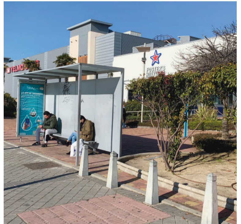
La mejora del transporte es esencial en esta zona

El consenso entre las partes implicadas, unido a las quejas de la ciudadanía, implica el cambio de ubicación e infraestructuras a través del Consorcio Regional de Transportes de la Comunidad de Madrid. El objetivo no es otro que proveer de seguridad, comodidad e información a los usuarios, colocando la parada unos metros antes, junto al cruce regulado por semáforos a la altura de varios comercios, para resolver definitivamente la problemática y prestar el mismo servicio que el resto de paradas de autobús.