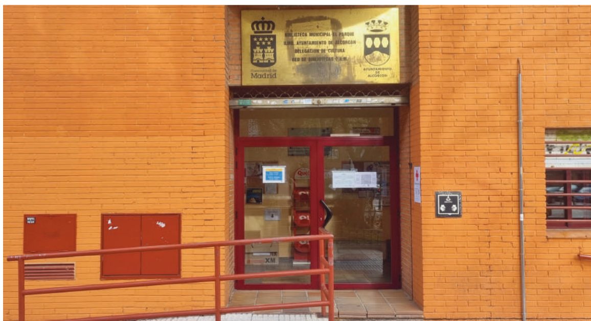
La biblioteca municipal 'El Parque', lugar escogido para homenajear a la escritora

La biblioteca municipal 'El Parque' será el lugar que la localidad ha elegido para ofrendar a Grandes por su extraordinaria calidad y su compromiso con la literatura