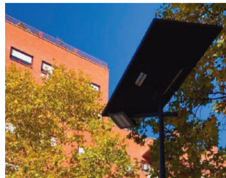
Una de las farolas del municipio con placas solares led

● El Ayuntamiento de Alcorcón ha puesto en marcha, a través de la empresa pública ESMASA, un proyecto piloto para la instalación de farolas, autónomas y sostenibles. Con esta iniciativa, se pone una vez más la innovación al servicio de la ciudad, en este caso para mejorar la iluminación, buscando conciliar la seguridad de los vecinos y vecinas con la sostenibilidad.