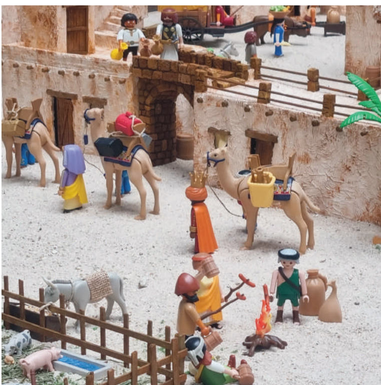
Más de 200 piezas forman el particular belén de Playmobil

Sin duda, la ciudadanía es la verdadera protagonista de esta programación que ha incluido