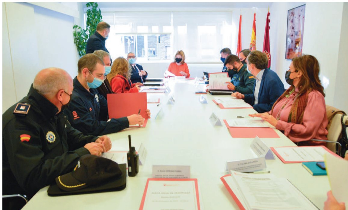
La Junta Local de Seguridad abordó diferentes cuestiones en materia de seguridad del municipio

En esta sesión se evaluaron los datos de la situación de la seguridad por parte de la Poli-