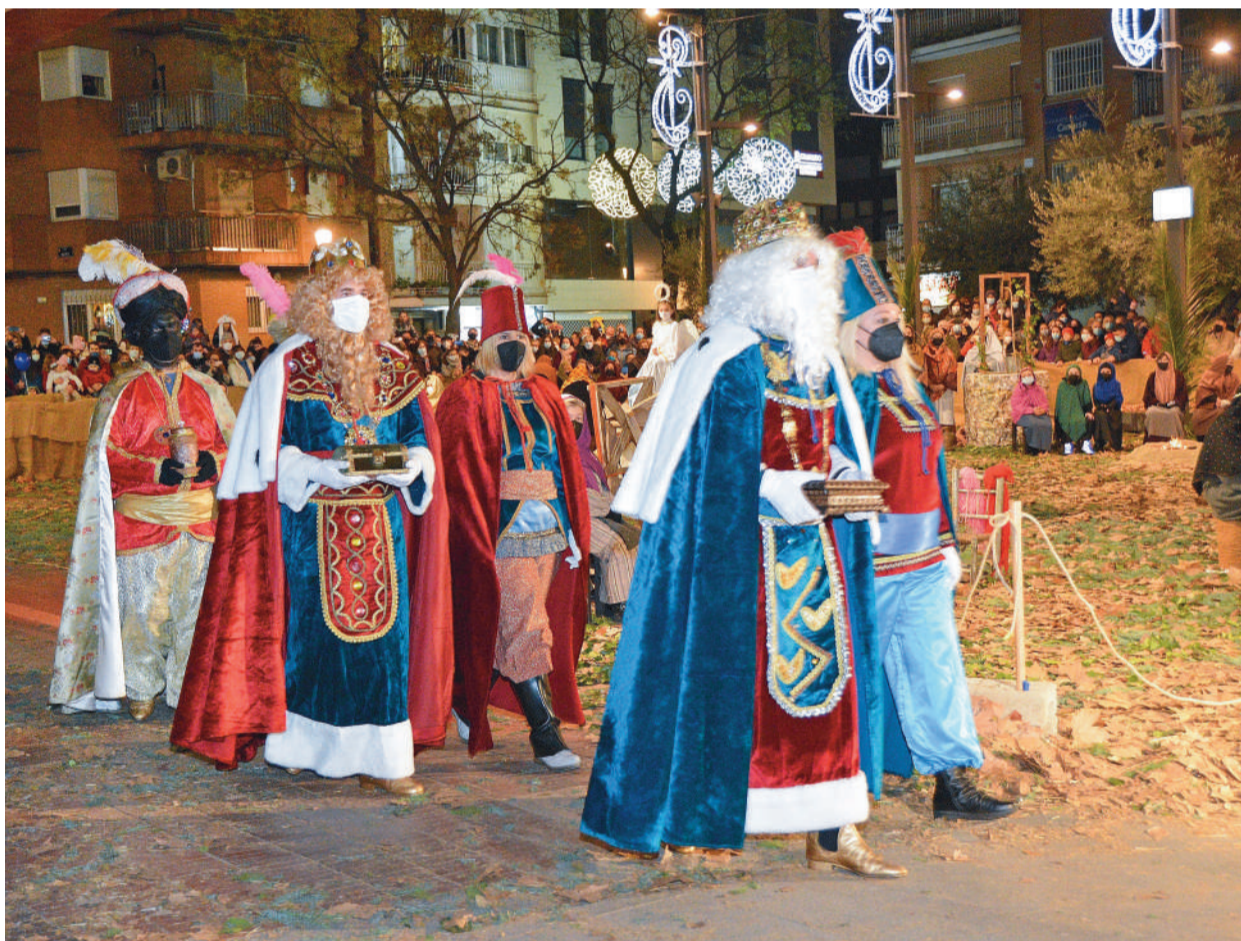
Pág. 8 y 9 Los Reyes Magos visitaron el Belén Viviente que se representó en la Plaza de España

● La programación navideña de Alcorcón ha llenado de ilusión las calles de la ciudad con diversas actividades para todos los gustos y edades para acabar con un colofón de lujo: la llegada de Sus Majestades Los Reyes Magos de Oriente a Alcorcón.