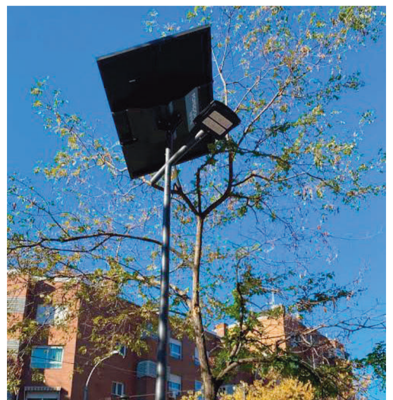
Una de las farolas del proyecto piloto del municipio

Esta iluminación se basa en energía renovable, con un impacto ambiental mínimo. Las baterías están programadas para calcular la carga disponible y ajustar el flujo luminoso en función de este, que tiene incorporado un sistema de apagones.