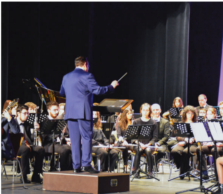
Esta escuela cumple 40 años de formación

Intérpretes de prestigio internacional han pasado por esta escuela y conservatorio, un centro referente a nivel estatal y europeo