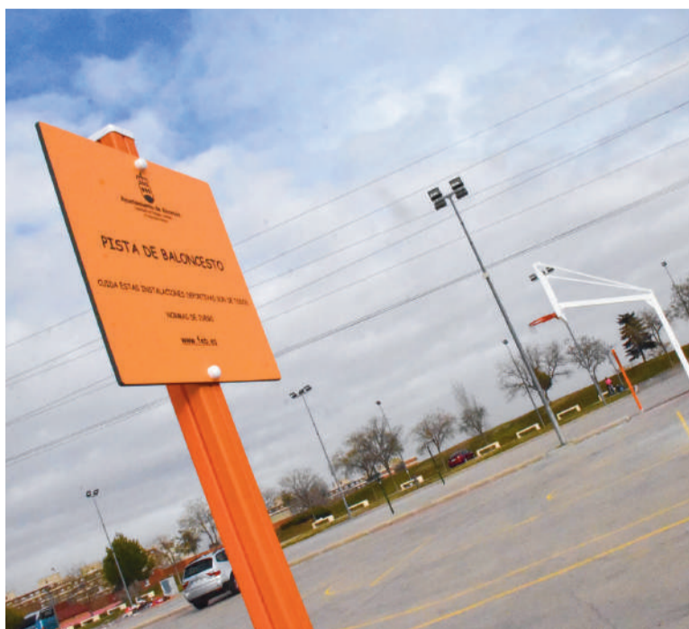
La reposición cuenta con un importe total de 40.108,55 euros de inversión

"Este equipamiento había sido retirado por el anterior Equipo de Gobierno, dejando el parque sin una dotación deportiva muy demandada por los vecinos y vecinas", señaló Raúl Toledano, quien añadió que "el Ayuntamiento de Alcorcón está realizando un importante esfuerzo para lograr renovar y recuperar espacios verdes, parques y jardines que se encontraban deteriorados y abandonados con el fin de que la ciudadanía cuente con unos espacios públicos de calidad.