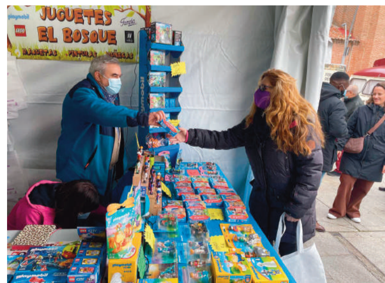
El comercio local será fortalecido con los presupuestos de este año

Además, se va a crear una Asesoría Laboral y de Acompañamiento en la Tramitación,