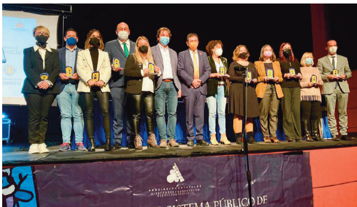
Premiados del XXVIII Congreso de la Asociación de Directores y Gerentes de Servicios Sociales

nes no periódicas, de naturaleza económica, destinadas a aquellas personas integradas en una unidad de convivencia cuyos recursos resulten insuficientes para hacer frente a gastos específicos, de carácter ordinario o extraordinario.