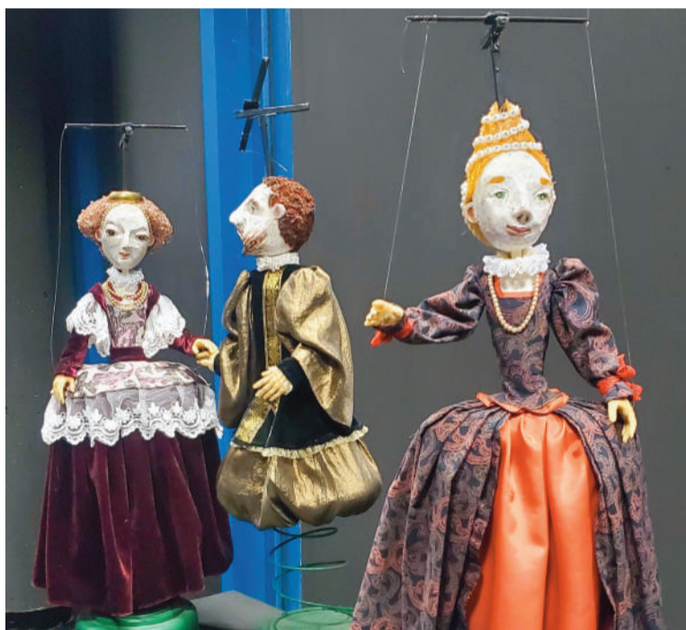
El Centro del Títere cuenta con una interesante exposición interactiva

Miguel Ángel Blanco, donde se realizan actividades de divulgación y cuenta con salas de exposiciones y exhibición de espectáculos, un laboratorio de investigación y creación, un centro de documentación y archivo y una escuela de formación profesional y abierta, entre otros espacios.