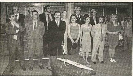
Grupo Socialista y Grupo Izquierda Unida

Y en este recorte del periódico Alcorcón Noticias Municipales de septiembre de 1999, vemos las imágenes de la constitución de la corporación en dicho año.