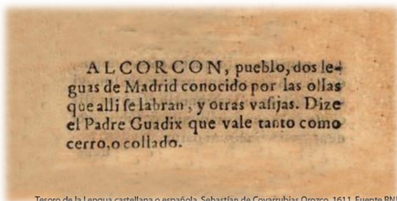
Tesoro de la Lengua castellana o española. Sebastián de Covarrubias Orozco. 1611.

La primera referencia documentada que habla con extensión de la existencia del Ayuntamiento de Alcorcón se encuentra en las “Relaciones histórico-geográficas-estadísticas de los Pueblos de España” de Felipe II (Respuesta del 17 de enero de 1576), en ellas se dice que es “aldea de la Villa de Madrid y, lugar de realengo, y de la jurisdicción real”, así como ayuntamiento del partido judicial de Getafe. Se citan como alcaldes a Antón Moreno y Martín Escolar. Pero existe un documento fechado el 28 de julio de 1208 en el que se menciona Alcorcón con motivo de la decisión de Alfonso VIII de favorecer a Segovia y ensanchar su influencia hasta Pozuelo, Móstoles y la cañada de Alcorcón.