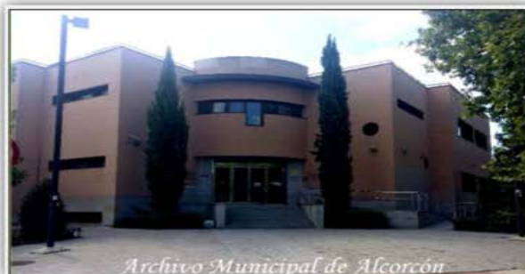
Archivo Municipal de Alcorcón

La información acerca del Archivo, que podemos encontrar en la cuenta de Twitter, está resumida en el siguiente documento: