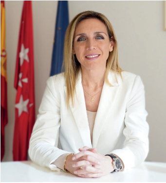
Candelaria Testa Romero Alcaldesa de Alcorcón

Cada nueva temporada, nos aproximamos a la programación de artes escénicas locales con gran expectación, con la curiosidad puesta en las actrices y actores que pisarán las tablas de los dos escenarios principales sobre los que se asienta la programación de nuestra ciudad, qué tipo de montajes encontraremos tras la apertura del telón o cuáles serán las temáticas con las que no solo entretengamos sino también mirar más allá de nuestra vida diaria, salir de nuestra realidad y afrontar desde lo colectivo otras perspectivas desde las que observar lo que nos rodea.