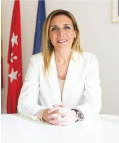
Candelaria Testa Romero Alcaldesa de Alcorcón

La salud ocupa un pilar central en las políticas municipales, vertebrando las iniciativas, programas o los servicios de las diversas áreas del Ayuntamiento. Bajo el prisma de la salud se orientan directrices que van desde la planificación urbana, con el diseño de parques y entornos seguros hacia los centros educativos; el apoyo a asociaciones de la sociedad civil, ofreciendo espacios municipales y ayudas; programación deportiva para todos y todas; y alianzas estratégicas con la ciudadanía, trabajadores y trabajadoras, personas mayores, juventud, infancia... Esto permite afrontar desafíos de salud física y mental de forma integral.